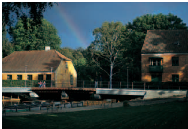
Møllen og slusen ved Frederiksdal.

I forbindelse med anlægget af fæstningskanalen blev møllens eksproprieret for at give plads til en sluse.